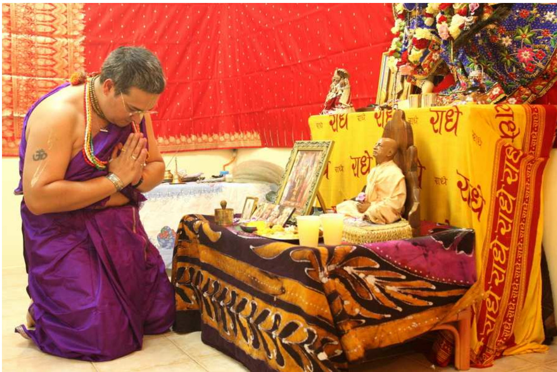
Cortesía de José Gutiérrez