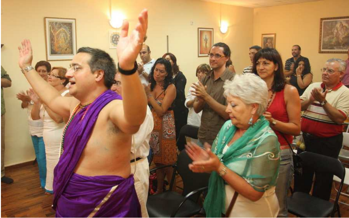
Cortesía de José Gutiérrez